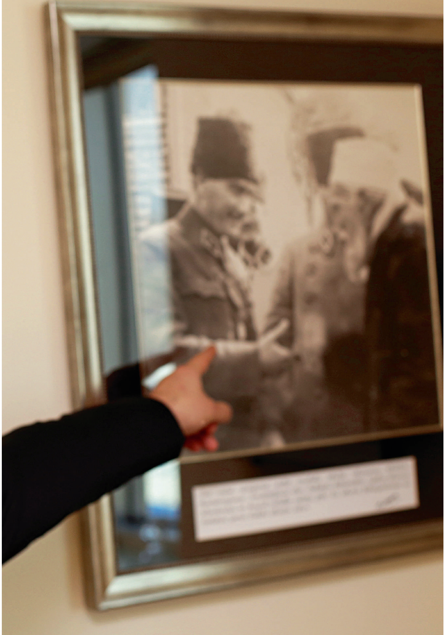
Two men in military uniforms, one pointing at the other. The photo is mounted in a gold-colored frame. A hand is visible in the foreground pointing at the photo.